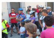
Fotos de la XIII Marcha BTT de Sancti Spiritus (Salamanca)