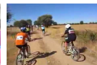
XIII Marcha BTT de Sancti Spiritus (Salamanca)